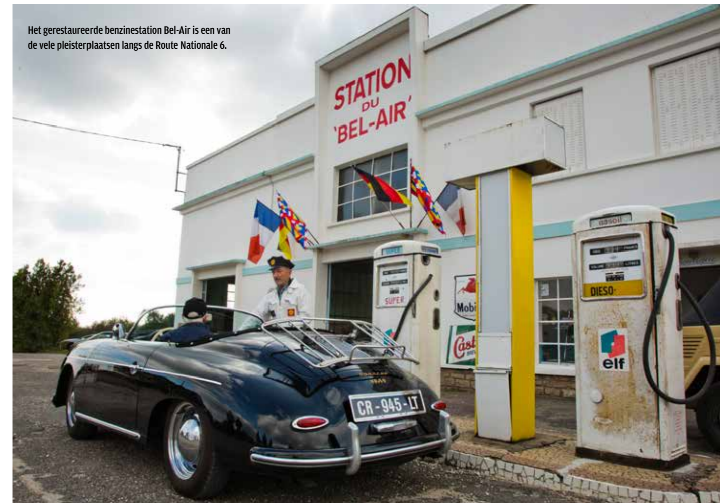
Het gerestaureerde benzinstation Bel-Air is een van de vele pleisterplaatsen langs de Route Nationale 6.

cierd met privékapitaal, is er opmerkelijk veel steun van de lokale en landelijke politiek. Niet in het minst van Alain Suguenot, de burgemeester van Beaune, die in oktober persoonlijk aanwezig was bij de symbolische eerstesteenlegging op het nu nog braakliggende terrein in La Rochepot. Niet geheel onbelangrijk voor een project waaraan milieutechnisch nogal wat haken en ogen vastzitten. Alle bezwaren hieromtrent werden echter door de gemeenteraad van Beaune met een grote meerder-