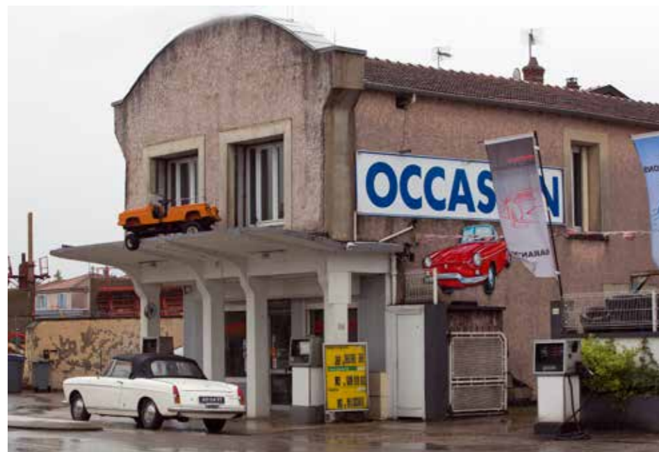
Voor dit soort nostalgische pompstations hoef je straks niet meer de hele Route Nationale 6 af te rijden.

rommelmarkten af, draaien weer vinylplaten uit de sixties en kleden zich als de hippies uit het flowerpower-tijdperk. Ik verwacht niet dat al deze trends zomaar op slag zullen doodbloeden, integendeel."