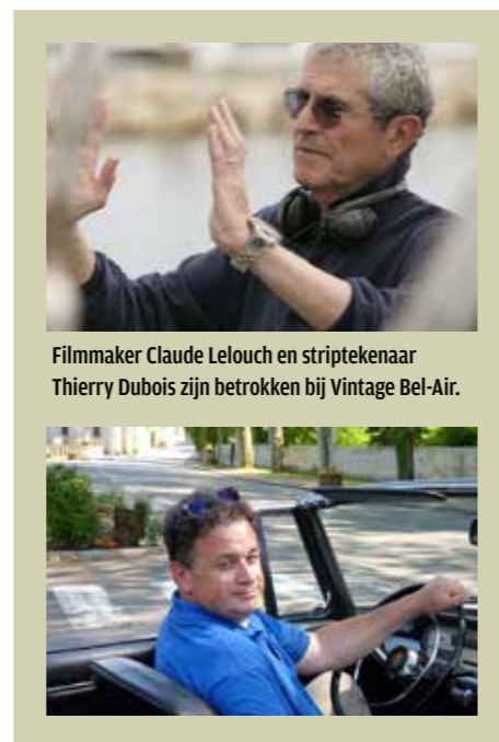
Filmmaker Claude Lelouch en striptekenaar Thierry Dubois zijn betrokken bij Vintage Bel-Air.

aanpassen aan het veranderende tijdsbeeld, maar ook alle andere pretparken moeten flink investeren om de bezoekersaantallen vast te houden. Dat is essentieel om de boel rendabel te houden. Het eerste jaar hopen we tussen de 75.000 en 90.000 bezoekers te mogen verwelkomen, wat gelijkstaat aan een jaaromzet van om en nabij de twee miljoen euro. Maar het is de bedoeling dat we dat bedrijfsresultaat binnen vijf jaar op z'n minst kunnen verdubbelen." Hoewel Vintage Bel Air grotendeels wordt gefinan-