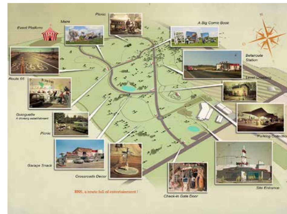
Een plattegrond met de voorlopige indeling van alle attracties.