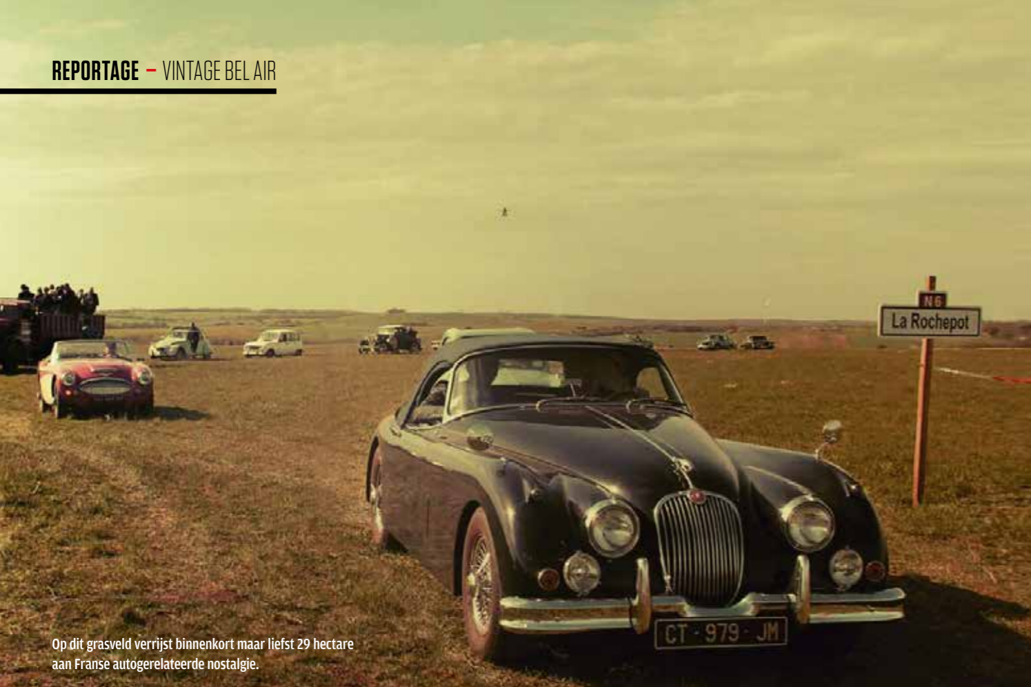
Op dit grasveld verrijst binnenkort maar liefst 29 hectare aan Franse autogelateerde nostalgie.

heid van tafel geveegd in het belang van de werkgelegenheid. Op zich niet zo verwonderlijk, want in 2015 heeft de Franse staat € 40 miljoen beschikbaar gesteld om de zogenaamde 'verwoestijning' en de daarmee gepaard gaande leegloop van het Franse platteland tegen te gaan.