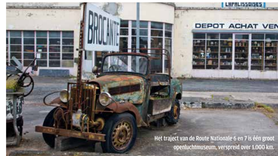
Het traject van de Route Nationale 6 en 7 is één groot openluchtmuseum, verspreid over 1.000 km.