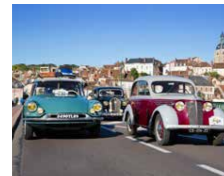
Wat nu nog over de Route Nationale 6 boemelt, kan binnenkort in La Rochepot z'n oldtimerhart ophalen.

'C'était un rendez-vous' gezien, zijn debuutfilm uit 1976 die Jeremy Clarkson ooit bestempelde als "the movie that made Bullitt look like a cartoon" ... In eerste instantie werd gedacht dat hij voor die razende rondrit door het ochtendlijke Parijs Jackie Ickx of Jacques Lafitte had ingehuurd, maar achteraf bleek dat hij zelf achter het stuur had gezeten! Ook voor Claude Lelouch was Vintage Bel Air de verwezenlijking van een lang gekoesterde jongensdroom. Voor ons allemaal, trouwens." ■